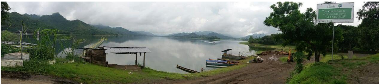
Ilustración 1 presa "La Esperanza".

se encuentran en buenas condiciones y existe el paso de transporte público al sector.